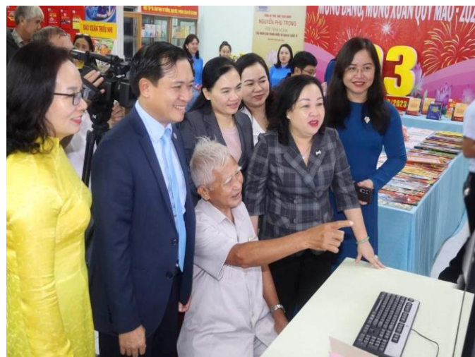
Không gian trưng bày triển lãm Thư viện tỉnh Bình Định Bạn đọc truy cập báo xuân trực tuyến Ninh Bình, Phú Yên