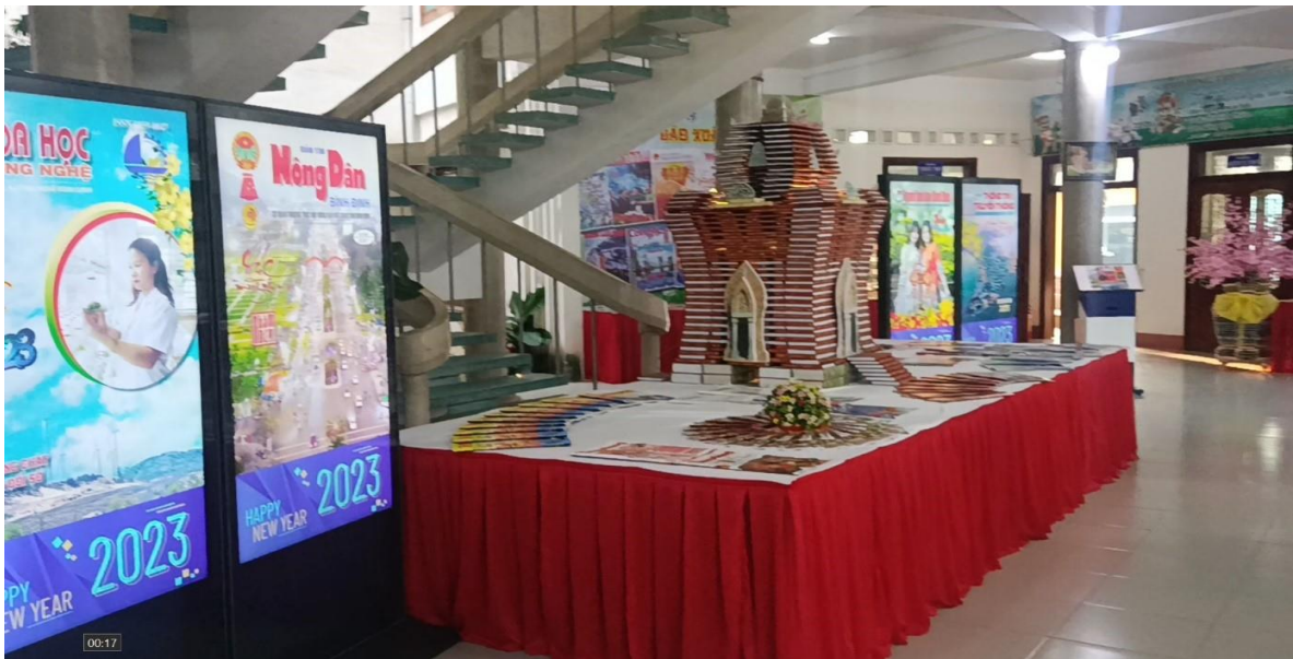
Một số hình ảnh Triển lãm báo trực tuyến tỉnh Khánh Hòa ( http://baoxuankhanhhoa.vuc.vn )