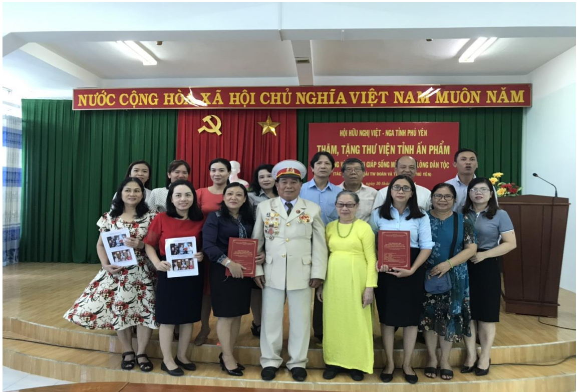
Thư viện tỉnh Phú Yên