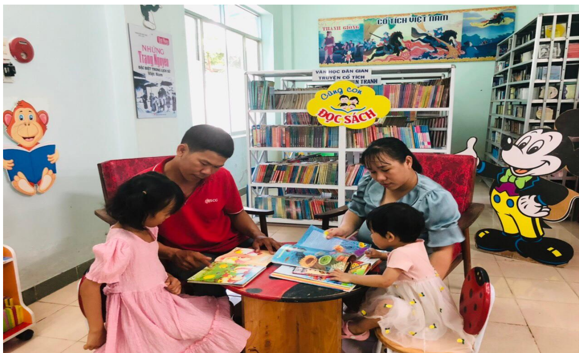
Một gia đình đang tham gia đọc sách cùng con tại thư viện

Hướng tới kỷ niệm 21 năm Ngày Gia đình Việt Nam (28/06/2001 – 28/06/2022) Thư viện tỉnh Phú Yên tổ chức các hoạt động trung bày, triển lãm và Hội thi “ Gia đình đọc sách ” với chủ đề “ Gia đình đọc sách - Gắn kết yêu thương ”. Thông qua các hoạt động này, thư viện tỉnh gửi đến các gia đình thông điệp về giá trị tốt đẹp mà sách mang lại cho con người, là cầu nối để gắn kết yêu thương giữa các thành viên trong gia đình. Qua đó, góp phần lan toả phong trào văn hóa đọc trong cộng đồng và xã hội.